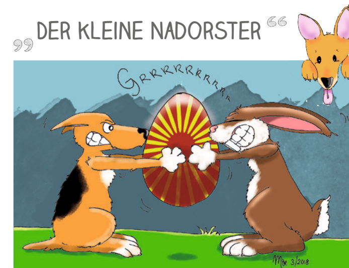
Der Kleine Nadorster wird gezeichnet von Mechthild Oetjen.

Was gibt es sonst noch zu berichten? In dieser Ausgabe geht es um das Thema Nachhaltigkeit. Wir appellieren noch einmal an alle Leser: Unterstützen Sie den lokalen Handel und kaufen öfter mal wieder im eigenen Stadtteil.